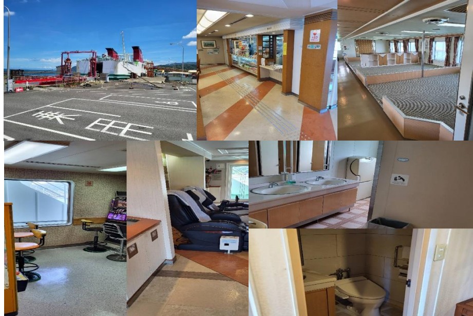
おおいた内部示意图

八幡濱港搭乘日本(れいめい丸)至別府港，採用沉穩的日本豪華風的室內設計，主要係努力改善旅客空間，讓旅客可以舒適的渡過搭船的時間，該船，該船基本資料如下：