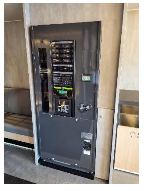
れいめい丸内部示意图