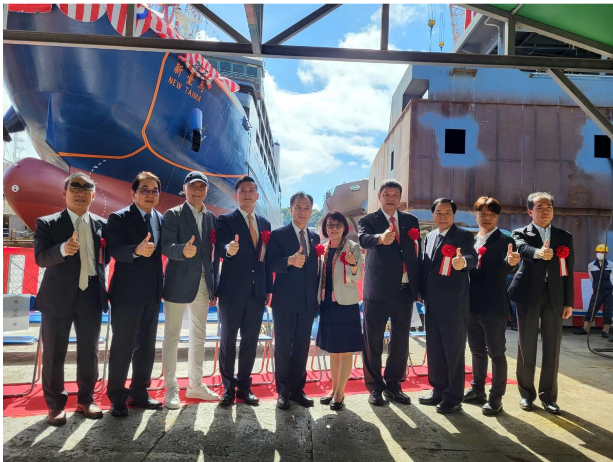
新臺馬輪下水典禮貴賓合影

本次參訪分別由白杵港搭船-八幡濱港，再由高松港-直島-豐島家浦港-豐島唐櫃港-土庄港再由八幡濱港-別府港進行跳島，因小島間接駁船型與臺灣較無差異，爰以較長程之船舶為主要參訪重點，本次由白杵港搭乘日本(おおいた)至八幡濱港，該船基本資料如下：